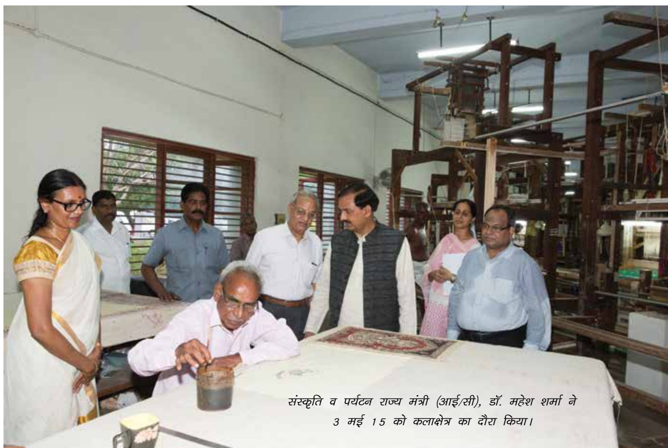
संस्कृति व पर्यटन राज्य मंत्री (आई/सी), डॉ. महेश शर्मा ने 3 मई 15 को कलाक्षेत्र का दौरा किया।